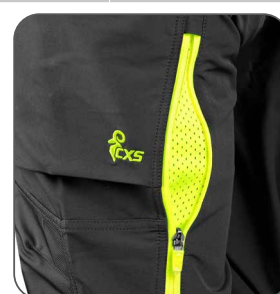
ventilace na stehně ventilácia na stehne thigh ventilation wentylacja na nogawce