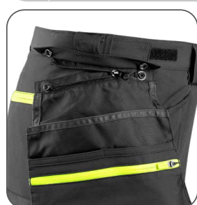
odepinací kapsy odnímateľné vrecká detachable pockets odpinane kieszenie