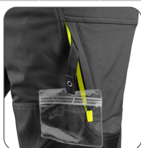
stehenná kapsa s vnútorným pouzdom na ID kartu stehenné vrecko s vnútorným držiakom na ID kartu thigh pocket with inner ID card holder kieszeń na udzie z miejscem na ID kartę